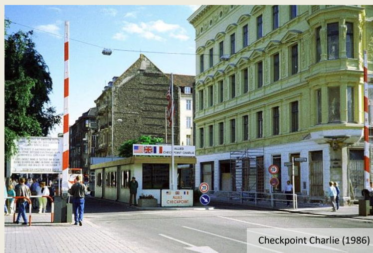
Checkpoint Charlie (1986)

Zijn we nu in het westen? Kennelijk niet, want enkele tientallen meter verder staat nog maar eens een bareel ons op te wachten. Weliswaar staat ie omhoog, maar doorrijden durf ik niet. In de deur van het wachthokje hangt een militair nonchalant met de schouder tegen de deurstijl, de jas open, de