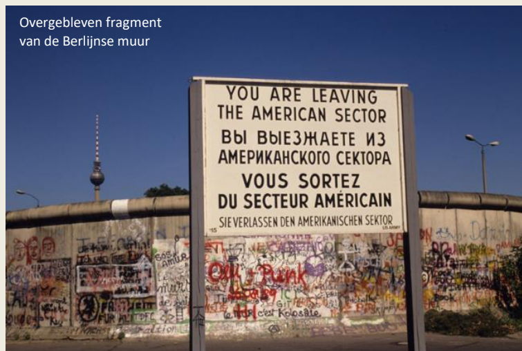
Overgebleven fragment van de Berlijnse muur

Bij wie kunnen we beter terecht met de vraag hoe je de DDR op een wettelijke manier kan verlaten dan bij Vopo's? Per slot van rekening zijn zij de specialisten ter zake. Want zij zijn het die ons met genoeg zouden neerschieten, mochten we het wagen de Muur op een onwettelijke manier over te steken. Met een vriendelijkheid die bijna onaards is, vraag ik aan één van de Vopo's waar Belgen de Muur mogen oversteken.