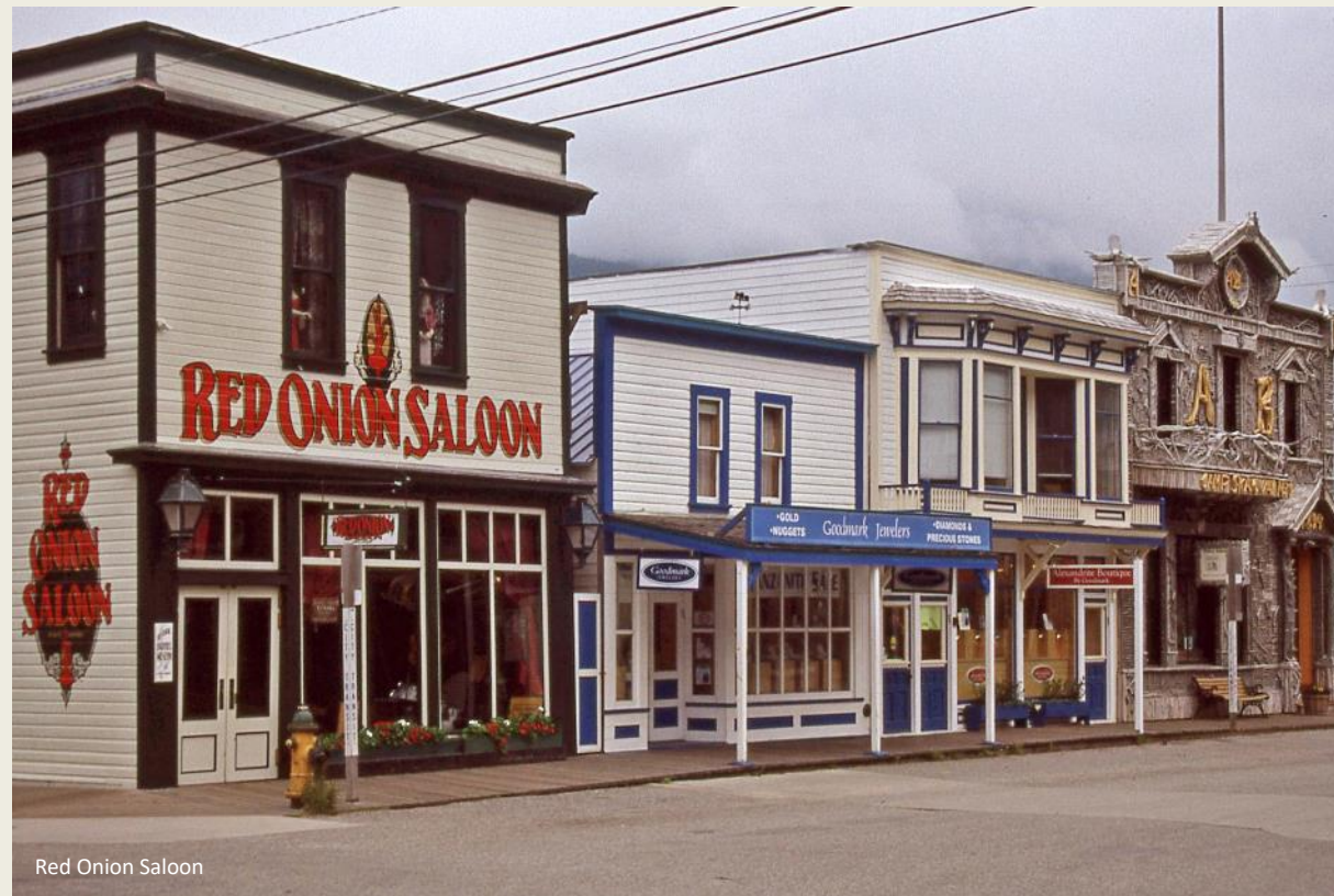
Red Onion Saloon

Jefferson Smith's Parlor was de plek waar de beruchte Soapy Smith zijn lucratieve zaakjes regelde. Daar runde deze lokale maffiabaas een telegraafkantoor waar pas aangekomen greenhorns of groentjes voor vijf dollar aan het thuisfront konden laten weten dat ze behouden aangekomen waren. Pure oplichterij was dat, want de telegraafdraden eindigden een paar honderd meter verder in de sneeuw. Toch kwam van het thuisfront stevast het antwoord dat ze zeer opgetogen waren over het goede nieuws, maar dat ze dringend geld nodig hadden. Als de greenhorns hem dat geld even wilden overhandigen, dan zou Soapy Smith wel voor de transmissie instaan. Uiteindelijk zou Soapy Smith op 8 juli