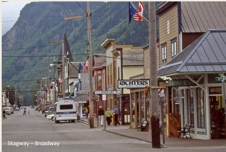
Skagway – Broadway