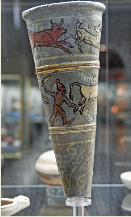
Kegelvormige rython (13e eeuw v.Chr.)