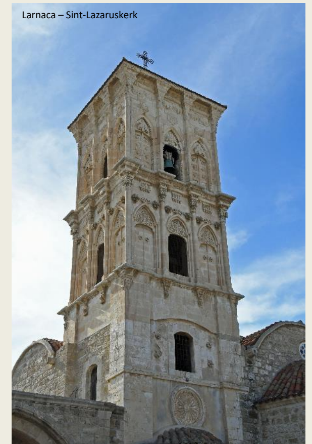
Larnaca – Sint-Lazaruskerk

Nog was Lazarus geen eeuwige rust gegund. Toen de Kruisvaarders in 1204 Constantinopel veroverden, namen ze heel wat kunstschatten en relikwieën mee naar huis. Zo ook het stoffelijk overschot van Lazarus. Dat werd in Marseille in de Cathédrale Sainte-Marie-Majeure bijgezet. Nog steeds kan je daar een gouden relikhouder zien die Lazarus’ stoffelijke resten zou bevatten. Maar