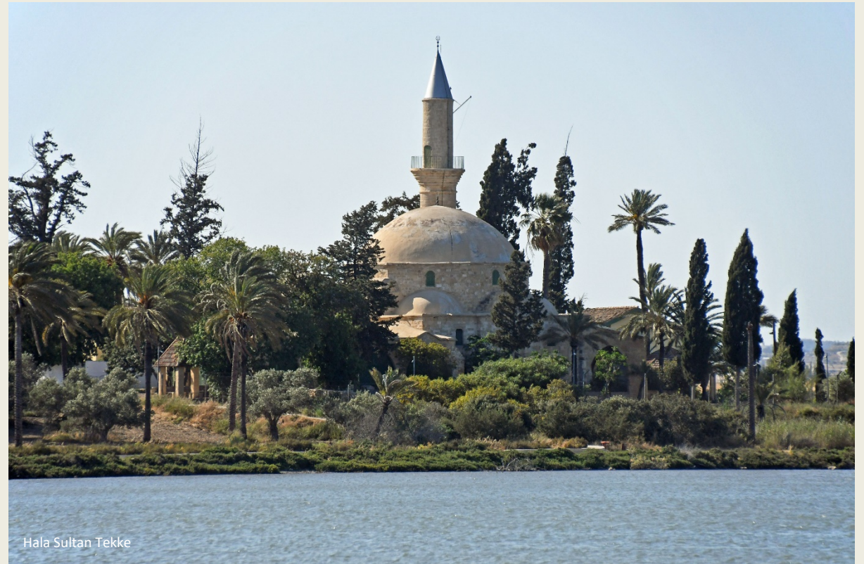
Hala Sultan Tekke

Helaas is Hala Sultan indertijd niet ten val gekomen in wat tegenwoordig de Turkse zone van Cyprus is, wat maakt dat de toestroom van moslims eerder beperkt is. Dat neemt niet weg dat het bezoek aan deze moskee zeer ernstig genomen moet worden. Mannelijke noch vrouwelijke knieën mogen blootgegeven worden (Art. 1 van het reglement). Hetzelfde geldt voor schouders van beiderlei kunne (Art. 2). Wie dacht zulke aperte tekortkomingen te verhullen door een sjaal, een pareo of iets dergelijks rond de lenden te slaan, kan het vergeten (Art. 3). En bovenal is het verboden met de bewakers van de moskee over de voorgaande punten in discussie te treden (Art. 8).