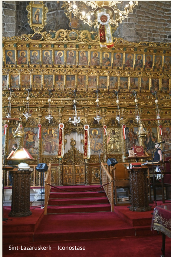
Sint-Lazaruskerk – Iconostase