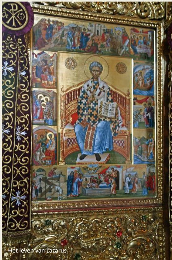
Het leven van Lazarus