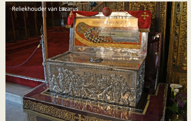
Reliekhouders van Lazarus