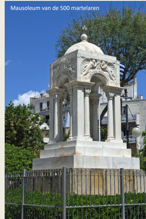
Mausoleum van de 500 martelaren

Veel aandacht gaat naar de Franse periode toen de Lusignans hier de plak zwaaiden, en naar de daaropvolgende eeuw van de Venetianen. In het bijzonder de overgang tussen beide tijdperken leverde een van die markante verhalen op waar Cyprus een patent op lijkt te hebben. Een verhaal met een zekere Catharina Cornaro in de hoofdrol. Als telg van een van de rijkste Venetiaanse patriciërsfamilies zou ze een belangrijke pion worden in het geopolitieke spel van de Republiek Venetië.