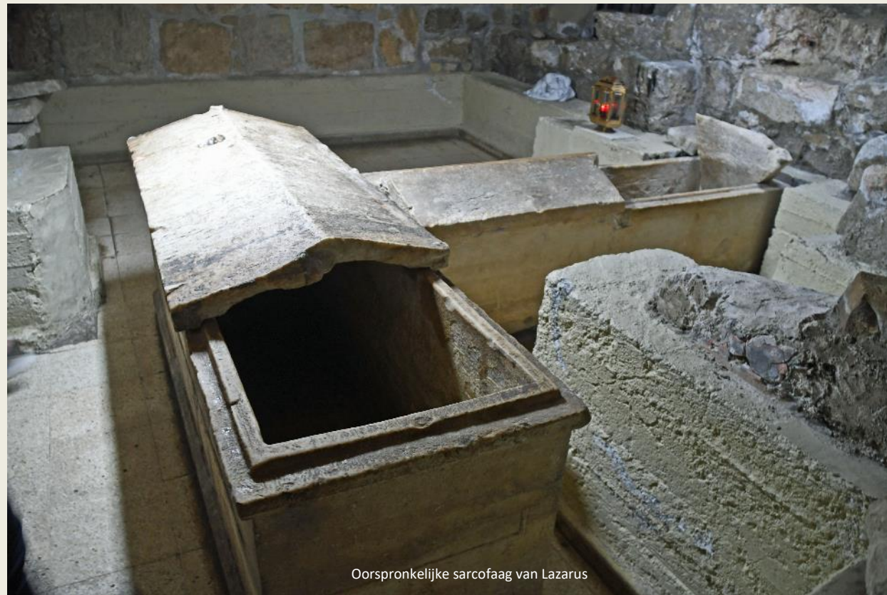
Oorspronkelijke sarcofaag van Lazarus