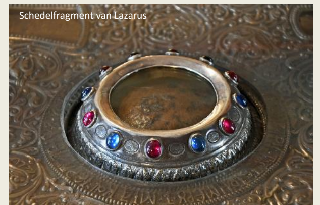
Schedelfragment van Lazarus

grootste die van Lazarus. In het stenen deksel van zijn sarcofaag is een conisch toelopende opening geboord. Daarlangs goten pelgrims olie naar binnen in de hoop dat die door contact met Lazarus' lichaam heilig en helend werd. Nu en dan werd het deksel geopend en de olie eruit geschepd.