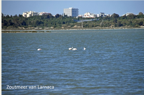
Zoutmeer van Larnaca

van natuursteen met enkele piepkleine ramen lijken een ruwe bolster te vormen die de precare inhoud beschermt. Ware schoonheid zit van binnen, denken we dan maar.