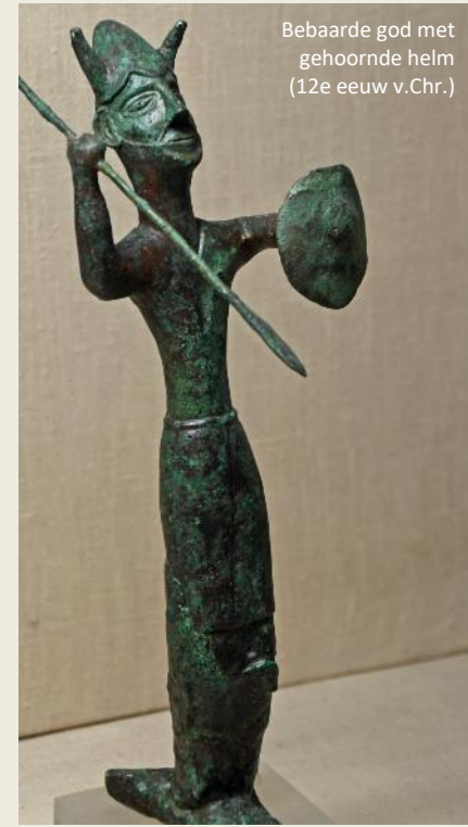
Bebaarde god met gehoornde helm (12e eeuw v.Chr.)