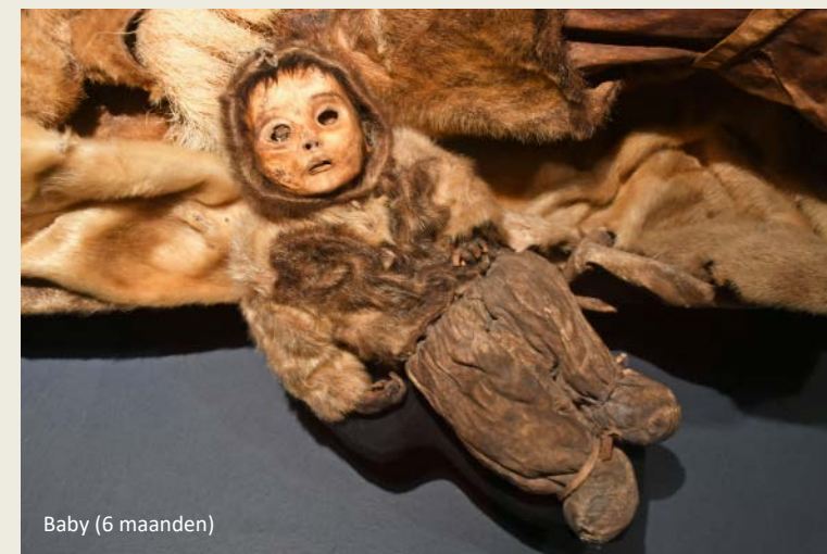
Baby (6 maanden)