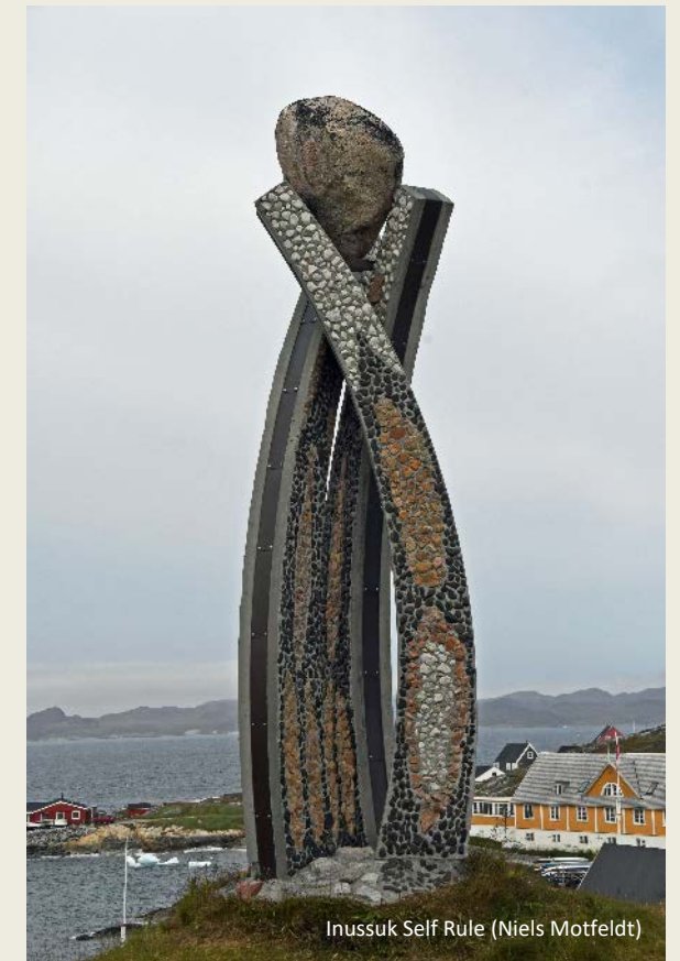
Inussuk Self Rule (Niels Motfeldt)

Bij de vrouwen daarentegen gaat het er veel kleurrijker aan toe. Het meest opvallend en het meest typisch ook is de veelkleurige kralenkraag die ze over hun roodsatijnen bloes dragen. Die bestaat uit duizenden monochrome glaskraaltjes waarmee een net van kleurrijke geometrische patronen vervaardigd is. Een titanenwerk moet het geweest zijn, zulke kralenkraag te maken. De hals van