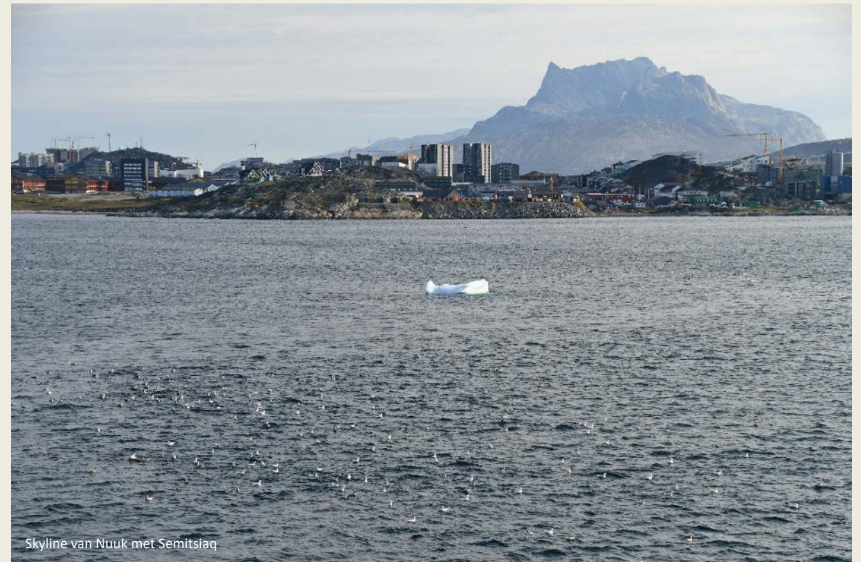
Skyline van Nuuk met Semitsiaq

Na het ontbijt zijn we de stad al wat dichter genaderd. Honderden meeuwen deinen mee met het golvende wateroppervlak, hier en daar drijft een kleine ijsschots op het water. De skyline van Nuuk komt nu stilaan in beeld. Het is niet de oubollige nederzetting die we misschien verwachtten. We zien appartementsgebouwen, haveninstallaties, tankreservoirs, containers, werfkranen. En gelukkig ook de typische Groenlandse huizen met hun felle kleuren.