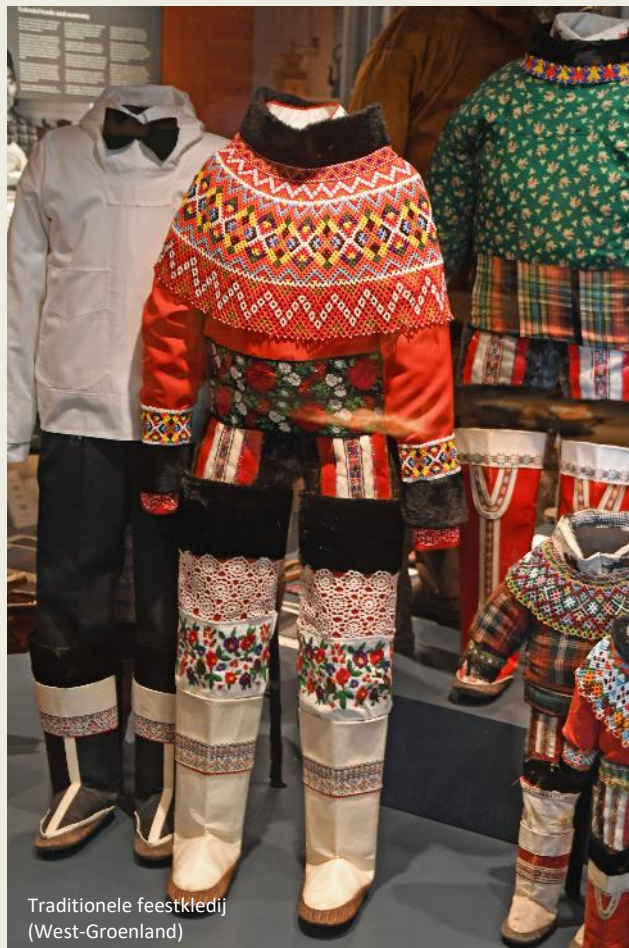
Traditionele feestkledij (West-Groenland)

De legende wil dat in een ver verleden een man die bij een gemeenschap van jagers hoorde, wou huwen met de jonge Sedna die op een eiland woonde. Haar vader stemde daarmee in, maar zelf zag zij dat niet zitten. Om haar op andere gedachten te brengen, begon haar vader een voor een haar vingers af te snijden en in zee te werpen. Zo is het leven in zee ontstaan. Sedertdien wordt Sedna de Moeder van de Zee genoemd, de beschermvrouw van de dieren en dan in het bijzonder van de zeezoogdieren. Zo nodig straft ze de mensen door alle zeedieren in haar haren te vangen, zodat de mensen geen dieren meer kunnen vangen en zullen verhongeren. Alleen een sjamaan kan dan nog redding brengen. Hij zal Sedna aanroepen en haar smeken om haar haren te kammen zodat de dieren weer vrijkomen.