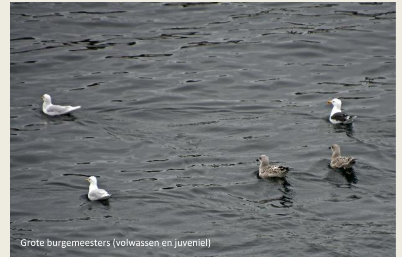
Grote burgemeesters (volwassen en juveniel)