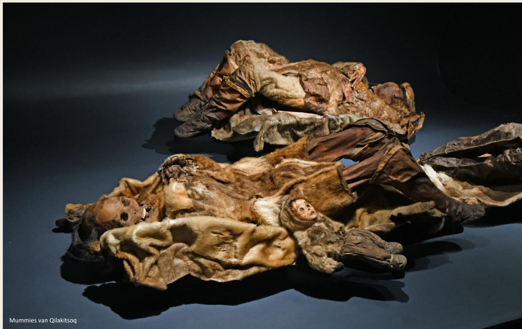
Mummies van Qilakitsoq

zijn. Voor natuurlijke mummificatie zijn de omstandigheden op deze plek optimaal gebleken – een koude, droge en goed geventileerde atmosfeer, beschermd tegen dieren en het weer. Maar het zou nog tot 1978 duren vooraleer de mummies aan een ernstig wetenschappelijk onderzoek onderworpen