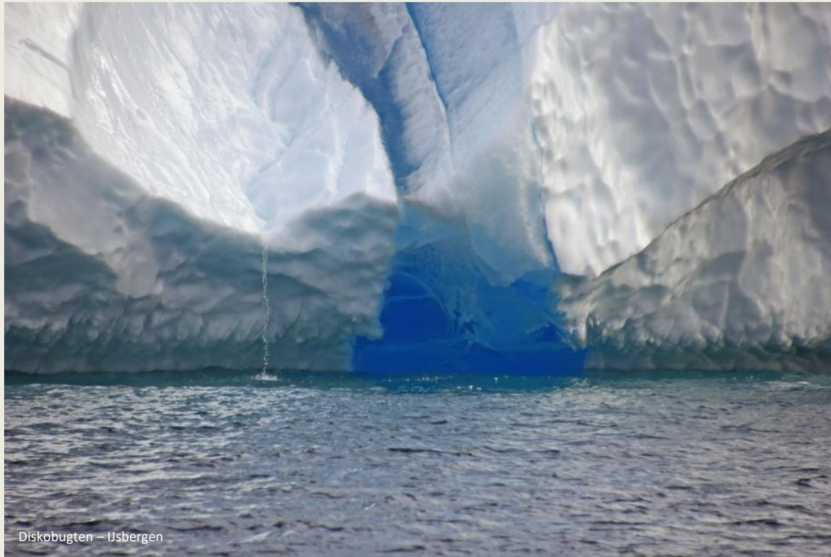
Diskobugten – Ijsbergen

zeer gevaarlijke situatie. Cruises moeten dan afgelast worden omdat de risico's te groot zijn.