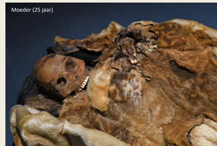
Moeder (25 jaar)