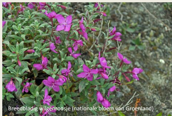
Breedbladig wilgenroosje (nationale bloem van Groenland)

In de jaren zeventig van de vorige eeuw schafte de Deense regering de subsidies voor kleine kustdorpjes af. De bedoeling was de mensen in grotere entiteiten zoals Sisimiut bijeen te brengen. Families ervoeren dat meestal als een zegen, omdat ze gemakkelijker toegang kregen tot winkels, onderwijs en gezondheidszorg.