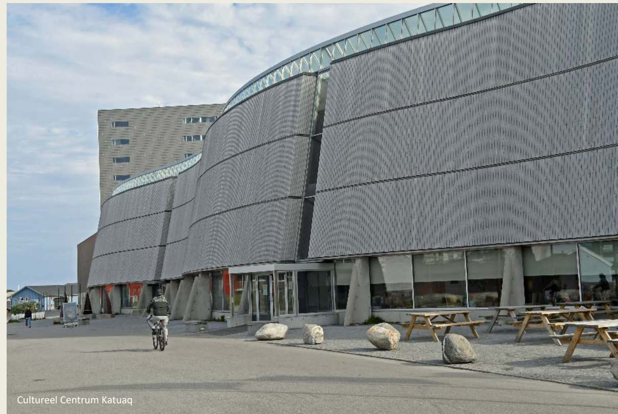
Cultureel Centrum Katuaq

Katuaq, het cultureel centrum, is de plek waar Yongna ons staat op te wachten. Ze zal ons tijdens de Nuuk City Tour door de stad