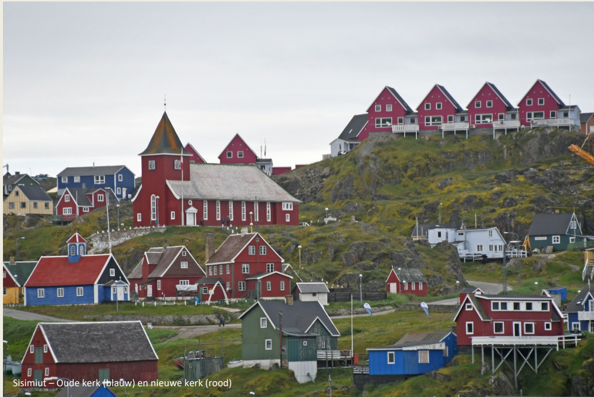
Sisimiut – Oude kerk (blauw) en nieuwe kerk (rood)