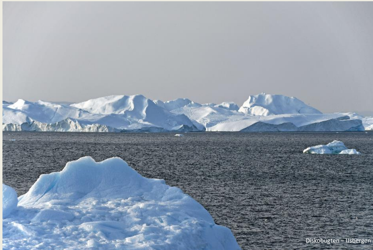
Diskobugten – Ijsbergen

Op de voorplecht kunnen we daar ten volle van genieten. Een legertje ijsbergen dobbert als een witte fortengordel voor de kust. Prachtexemplaren zijn het, stuk voor stuk, met afmetingen om van te duizelen. En dan hebben we het nog maar alleen over het