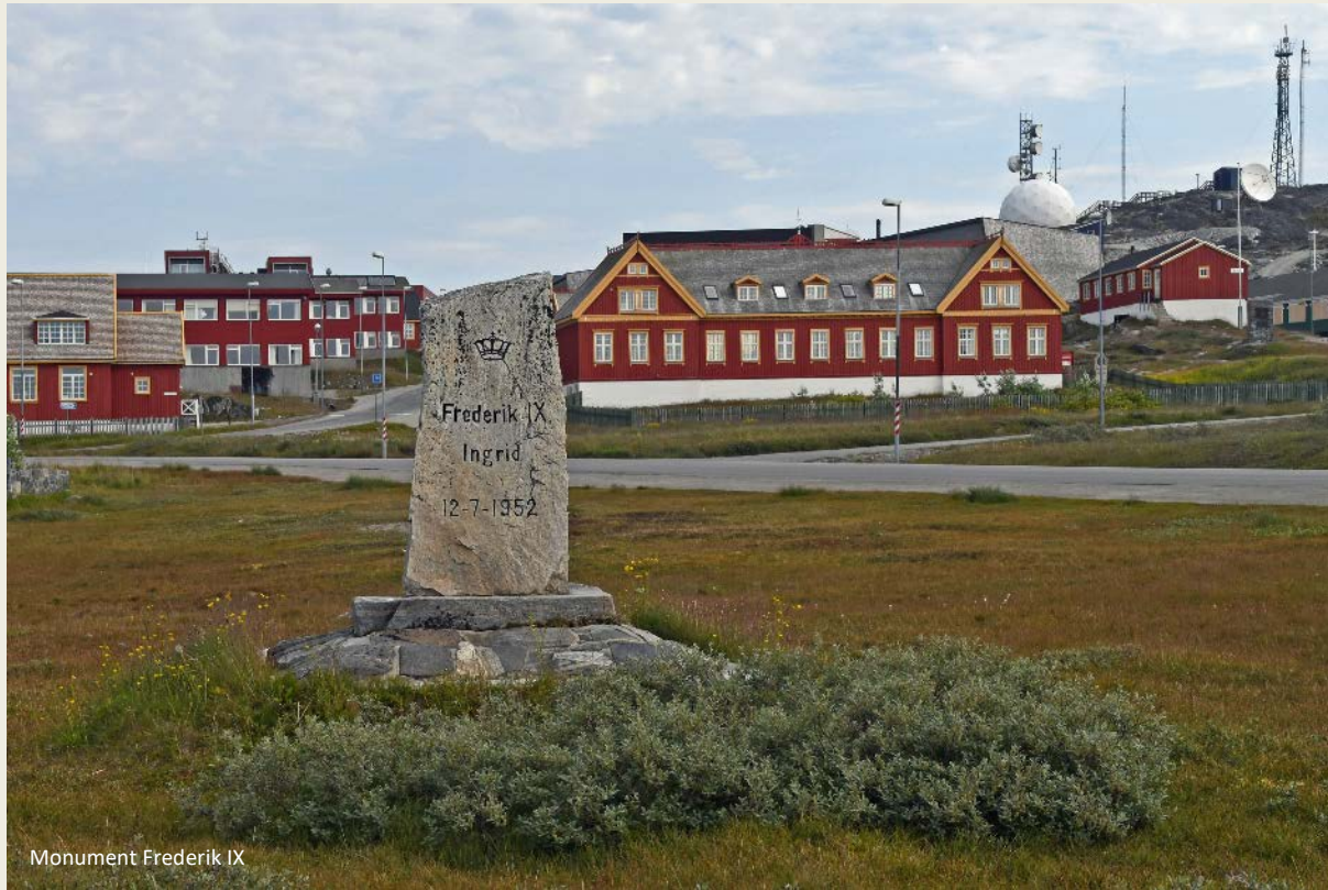
Monument Frederik IX

meepikken, daar houden ze ook van. Van daar de vele affiches van recente films.