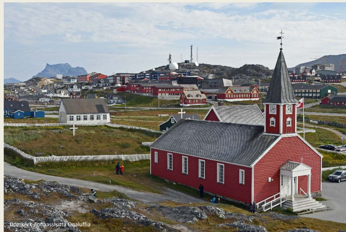
Domkerk Annaassisitta Oqaluffia

Hoger tegen de hellingen staan de kleurrijke houten huizen die Groenlandse nederzettingen zo pittoresk maken. Dat ze zoveel op elkaar lijken komt voort uit het feit dat ze als een soort zelfbouwpakket uit Denemarken arriveren – een IKEA voor woningen. Privéwoningen mogen in een willekeurige kleur geverfd worden. In de praktijk gebruikt men meestal de verf die toevallig op dat ogenblik in de winkel beschikbaar is. Voor officiële gebouwen geldt wel een kleurencode – geel voor ziekenhuizen en dokterswoningen, rood voor kerken, scholen, leraarswoningen en handelszaken, groen voor energiecentrales, garages en de telecomsector, blauw voor de visverwerkingsindustrie en zwart voor politiekantoren.