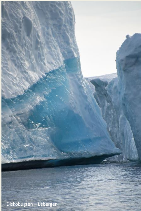
Diskobugten – Ijsbergen