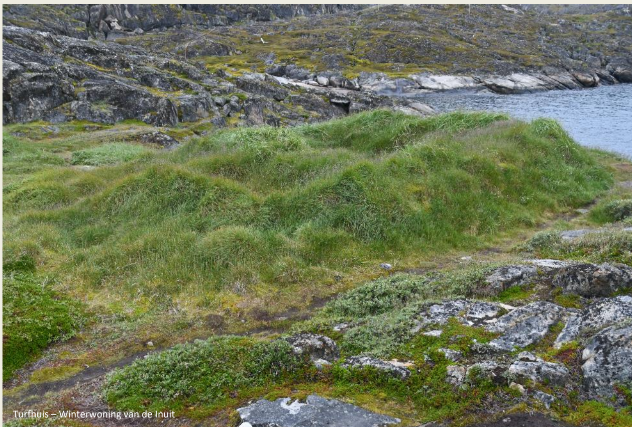
Turfhuis – Winterwoning van de Inuit