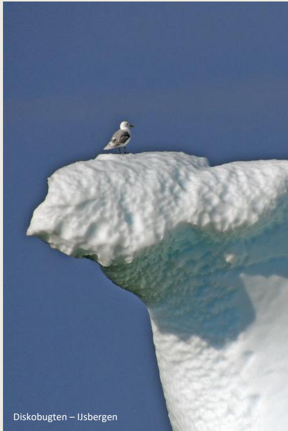
Diskobugten – Ijsbergen