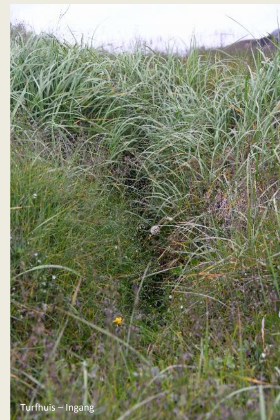
Turfhuis – Ingang