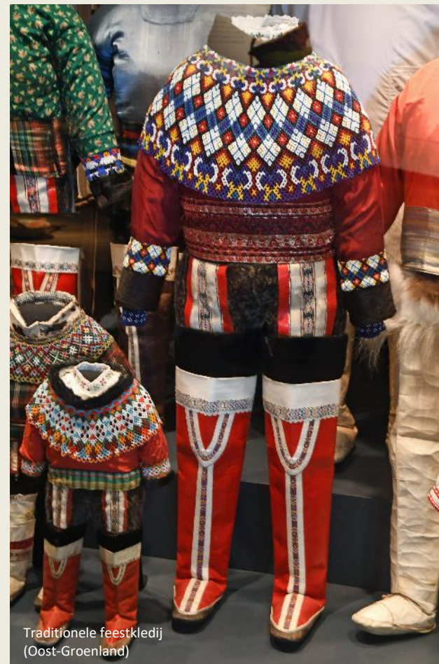
Traditionele feestkledij (Oost-Groenland)

Even later bereiken we het Nationaal Museum en Archief van Groenland , het oudste en tevens grootste museum van Groenland. Niet alleen recente archeologische vondsten hebben hier een onderdak gevonden, maar ook de artefacten die door de Deense kolonistator de afgelopen eeuwen naar het Nationaal Museum van Denemarken in Kopenhagen verscheept zijn. Daar heeft Home Rule voor gezorgd. Dat repatriëringsproces begon